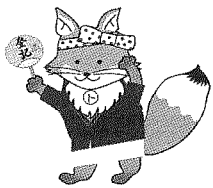
不動産登記推進イメージキャラクター「トウキツネ」