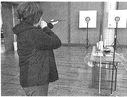
美波会場 ラダーゲッター

今回の交流を一つの契機として、今後それぞれの地域において積極的にニュースポーツに取り組むことで、健康の維持・増進に努めていただくとともに、交流の輪を広げ、老人クラブの活性化や会